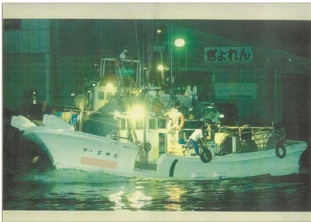
写真6 B船の転覆状況