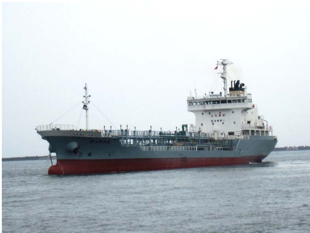
写真2 A船の船首部損傷状況①