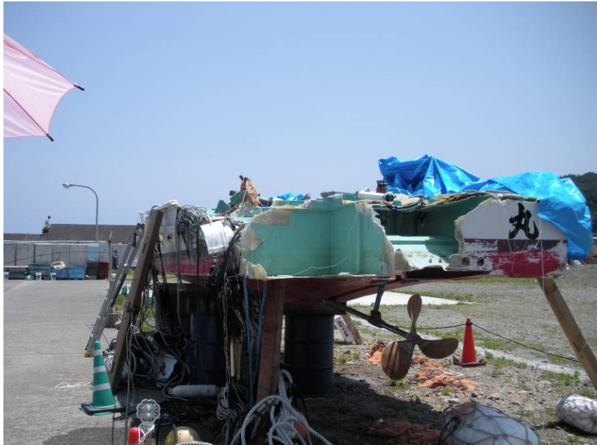
写真4 プロペラの状況