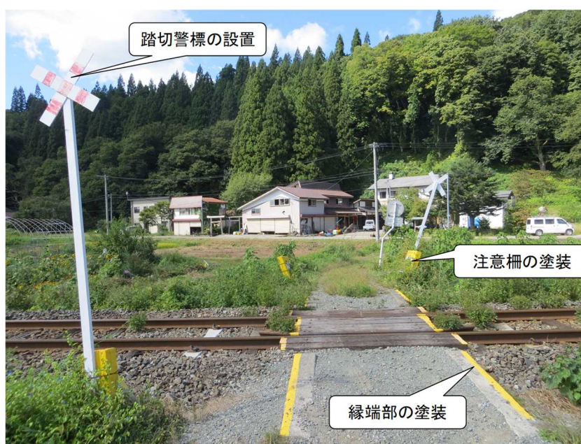
図9 同社による安全対策実施状況