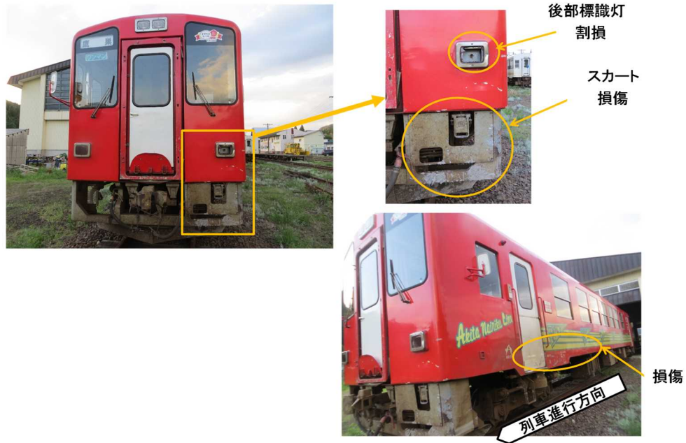
図8 車両の損傷状況

(3) 本件農機 本件踏切の八津駅方左側に横転し、本件農機本体の前方部が破損していた。