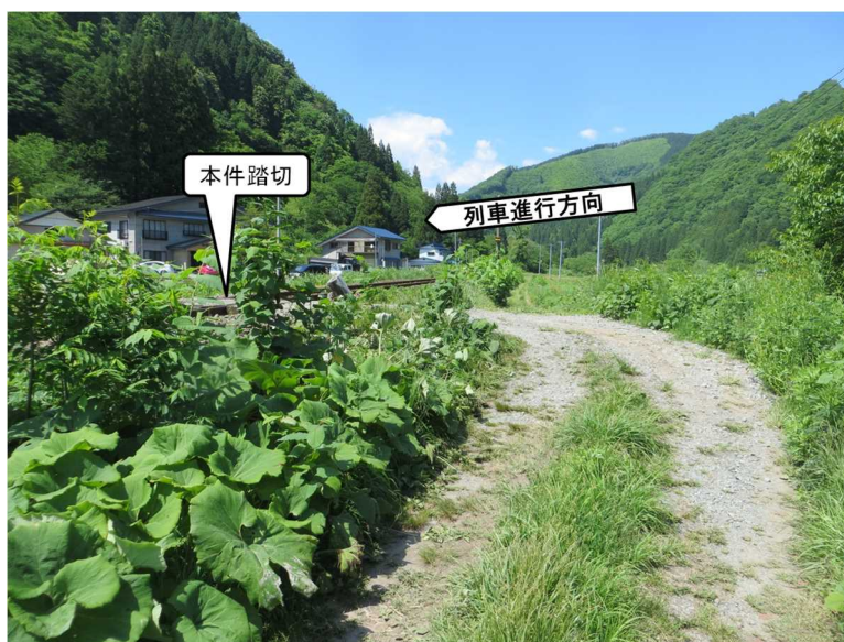
図3 図1のA側からの見通し状況（本件踏切の約10m手前から撮影）