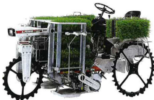
図6 本件農機と同型式の農業機械（カタログより抜粋）