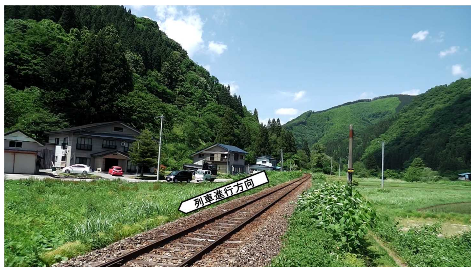
図4 本件通行者進入側からの列車の見通し

本件踏切における本件通行者進入側からの下り列車の見通し状況については、(1)に記述したとおり列車見通距離200mであり、本件踏切の付近（軌道中心から約3mの位置）から確認したところ、通行者の視界を遮るような障害物は認められなかった。（図4 参照）