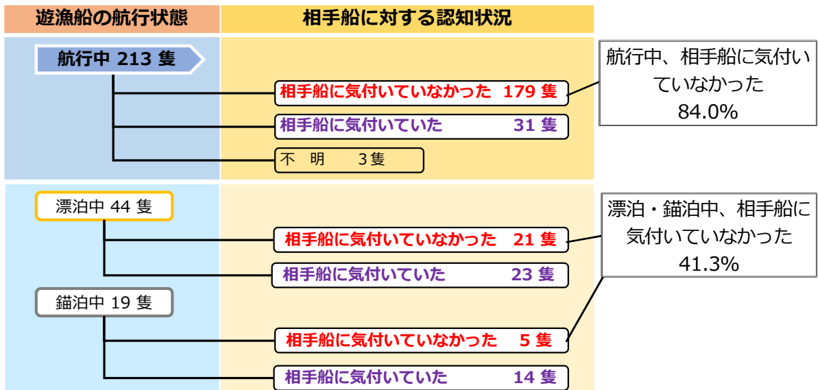
図 4 航行状態ごとの相手船に対する認知状況

その一方、相手船に気付いていながら、結果的に衝突した遊漁船は、航行中が 31 隻、漂流中が 23 隻、錨泊中の遊漁船では 14 隻でした。(図 4 参照)