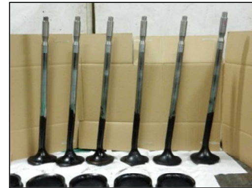
〈曲損した吸気弁の弁棒〉