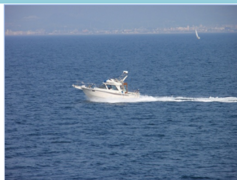
マリンレジャーに関連する船舶事故等（割合及び隻数）

そこで、本号では、夏場のマリンレジャーシーズンを迎える前に、愛好者のみなさんの事故防止の一助となるよう、マリンレジャーに関連する事故等の発生状況を取りまとめるとともに、公表された事故調査報告書をもとに重大事故調査事例を紹介することといたしました。